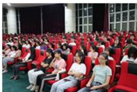
职业生涯规划讲座系列