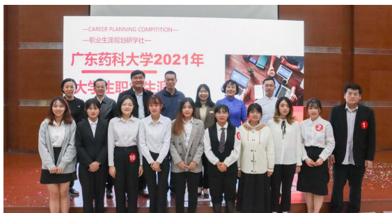
2021 大学城、中山、云浮三校区大学生职业生涯规划大赛