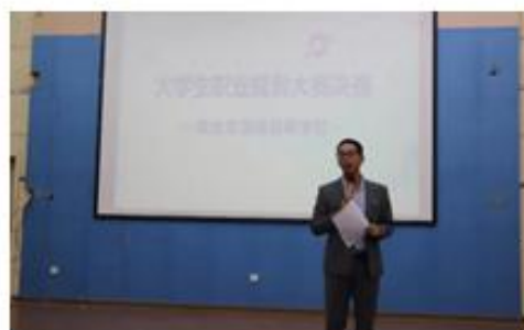
第一届职业规划大赛