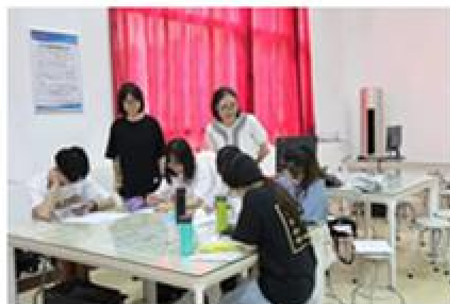
职业生涯规划假期训练营