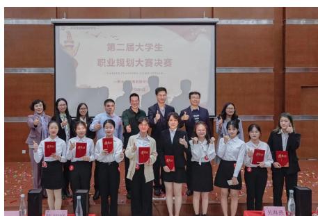
第二届职业规划大赛