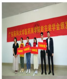
毕业生设立专 业奖学金