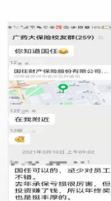
毕业生提供 行业信息