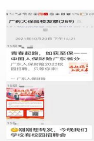
毕业生提供就业 信息