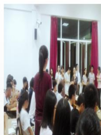
毕业生返校 与在校生交流

学生普遍存在从进校门对专业的不认可到毕业时感激学校的栽培转变，毕业生积极反馈学校，积极参加各种形式的师兄弟交流会，提供行业信息，并创立奖学金等鼓励师弟师妹。