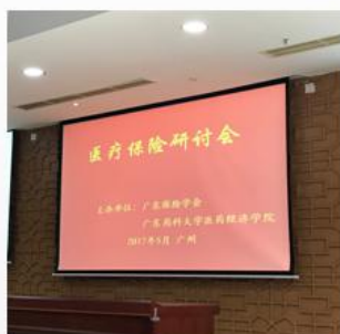
承办医疗保险研讨会