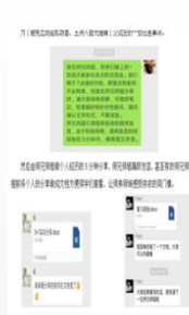
毕业生线上为在 校生进行就业指 导