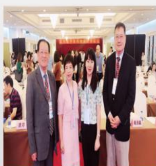
参加多种类型学术会议