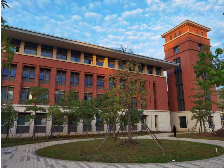
图3 护理核心能力情景教育与训练中心

教学方法,实现培养过程规范化、考核评价多元化和人才出口同质化。除此之外,在云浮实验中心还有共享平台,比如健康评估实验平台、客观结构化临床考试(OSCE)平台等为护理学人才培养提供重要保障。