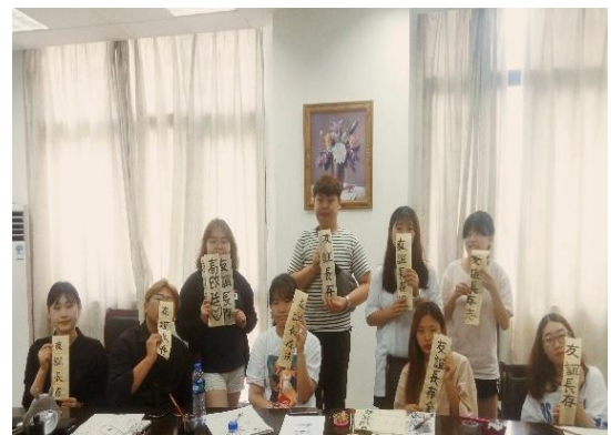
图为我院学生与韩国来校访学大学生友好交流