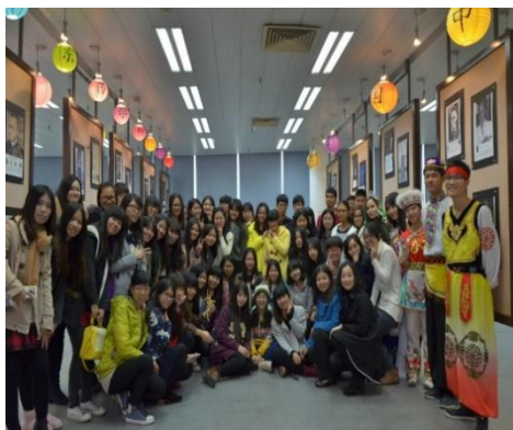
图为我院学生与日本来校访学大学生友好交流

学院积极承办中日、中美、中韩等文化交流活动，促进中外学生之间的交流与联系，开拓学生国际视野，提升学生跨文化交际能力。