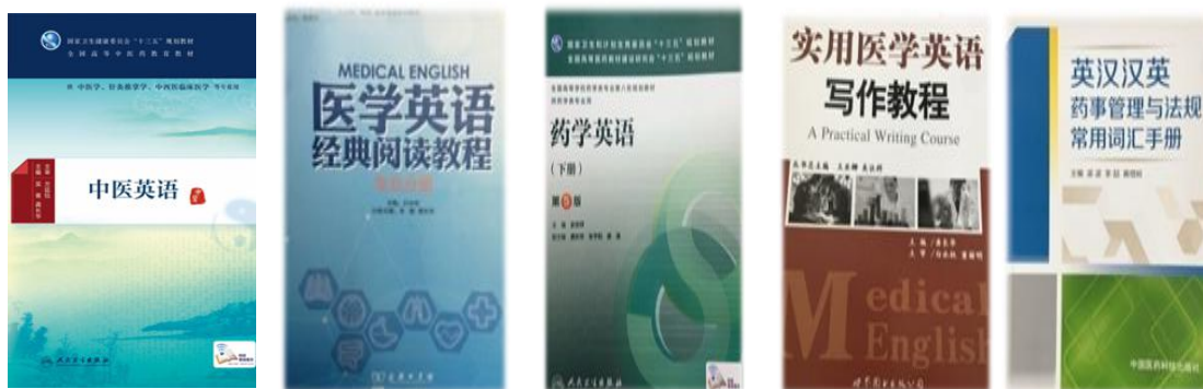
图为我院教师主编、参编部分教材