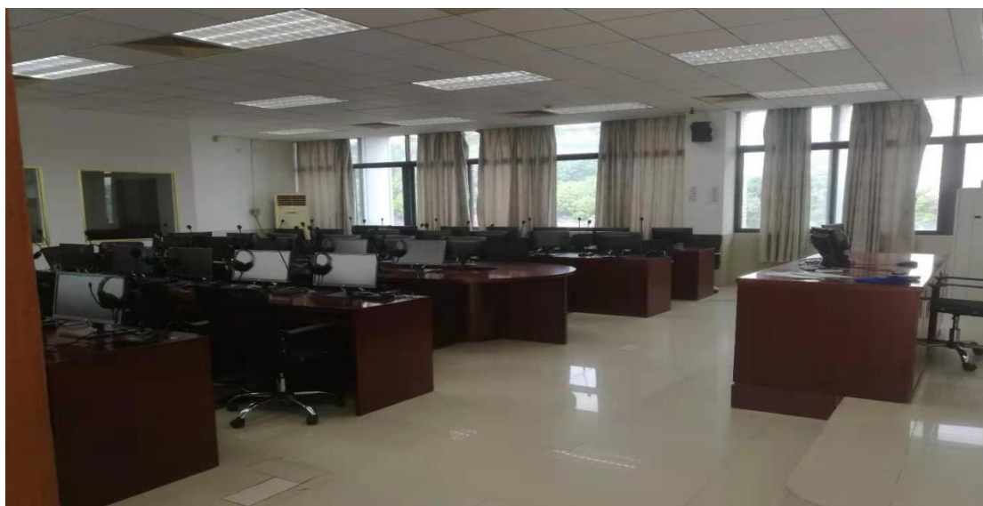
图为英语专业同传翻译实验室

学院现有英语专业语言实验室 1 间，同传翻译语言实验室 1 间，用于英语专业视听说及翻译实践练习；签约 4 家校外教学实习基地以满足英语专业见习实践及毕业教学实习；成立“医药英语研究中心”，着力培养学生扎实的英语专业基础；成立“大学生英语综合技能训练中心”，坚持“以竞赛促教学”，着力培养学生英语思辨能力，提高中外文化素养。