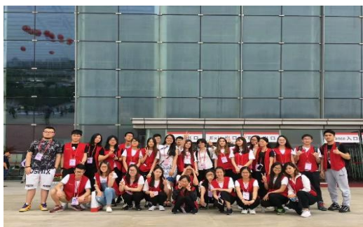
图为我院学生参加春交会实习