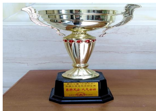
图为我院 13 级学生郭清慧获第 20 届“外研社杯” 全国大学生英语辩论赛“思辨风云 人气女神”称号

近几年来，“医药特色”英语专业人才培养效果明显。2020 年和 2021 年连续两年获得世界中医药学会联合会翻译专业委员会主办的世界中医翻译大赛集体一等奖，英语专业 14（2）班张鑫会同学、2017（2）班何紫琪、2018 级（1）班陈泳同学和宋绮薇同学以及 2019 级（1）班陈怡冰和林晓淇同学等获得个人优秀奖。