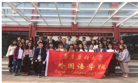
图为我院学生进药企见习