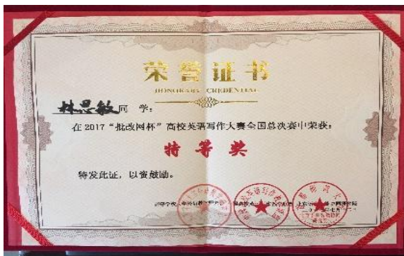
图为我院 14 级林思敏同学获 2017 “批改网杯” 高校 英语写作大赛全国总决赛特等奖