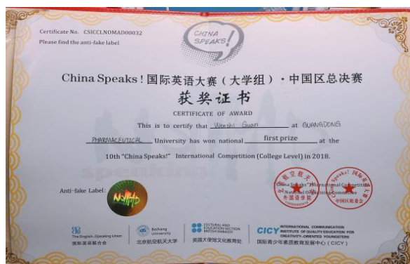
图为我院 15 级学生关文诗获第十届“China Speaks”国际英语大赛（大学组）中国区总决赛一等奖