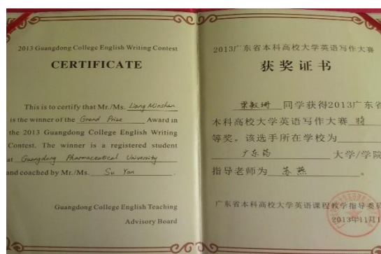
图为我院 12 级学生梁敏珊获得年广东省本科高校大学生英语写作大赛特等奖